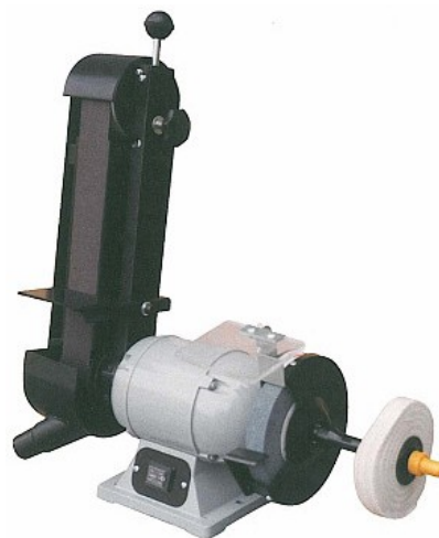
Modèle avec rallonge et frotte BGC-150/F

Le modèle BGC-150/F est livré avec rallonge, disque coton, brosse.